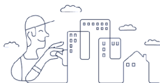
Mūsų paskirtis –