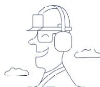
Mūsų vertybės –

Pasitikėjimas Pagarba Orientacija į sprendimą Dėmesys klientui