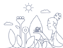
Mūsų kryptis –

Turimo verslo auginimas ir strateginė plėtra