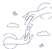
Mūsų strategija –

Pasitikėjimas Pagarba Orientacija į sprendimą Dėmesys klientui